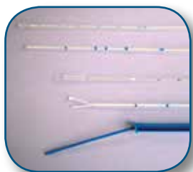
E404 Endorette, steril E402 Pipelle Cornier, steril